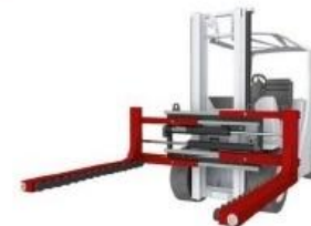
8 Захваты для блоков