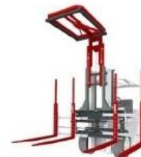
7 Стабилизаторы груза