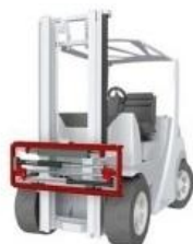
2 Позиционеры вил